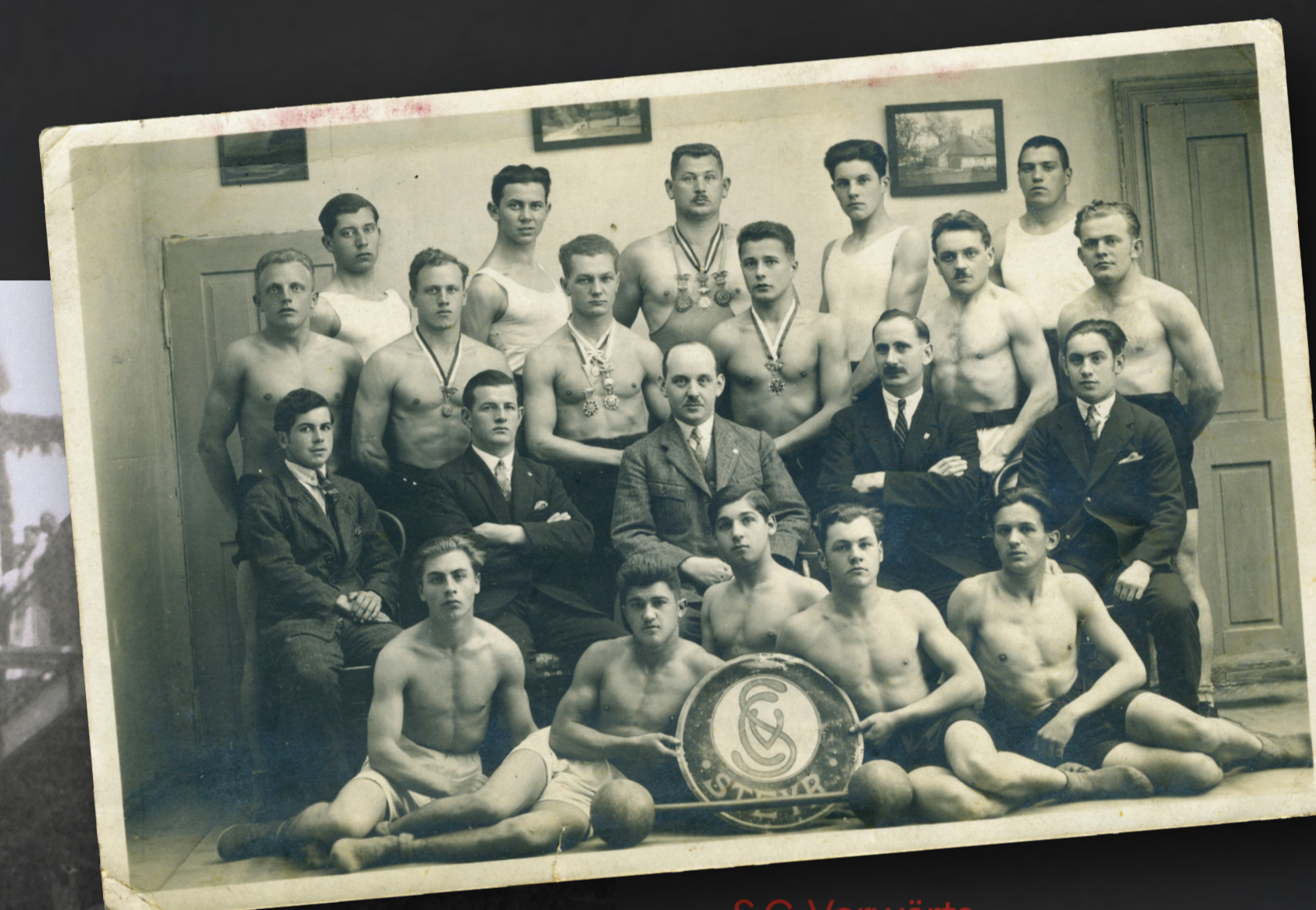
S.C. Vorwärts - Sektion Schwerathletik, 1925

Anfang der 1930er-Jahre sinkt die Mitgliederzahl, gekoppelt mit den wirtschaftlichen Einbrüchen, drastisch ab, weil sich viele einfach den Parteibeitrag nicht mehr leisten können. 1932 sind beispielsweise 72 Prozent aller SDAP-Mitglieder ohne Beschäftigung.