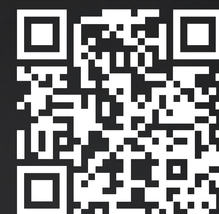
Plan und Podcasts