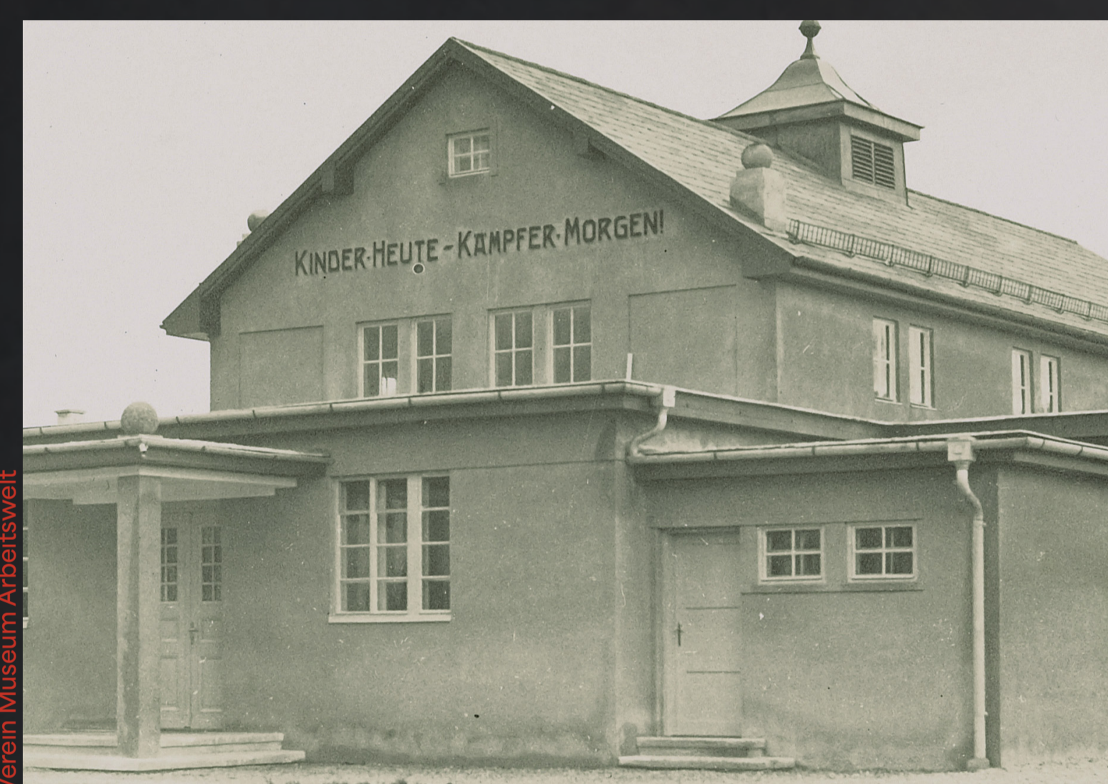
Das ehrenamtlich von Arbeiter:innen erbaute Kinderfreundeheim (heute: Kindergarten Marxstraße) ist gleichzeitig Zentrum der Sozialdemokratie auf der Ennsleite...